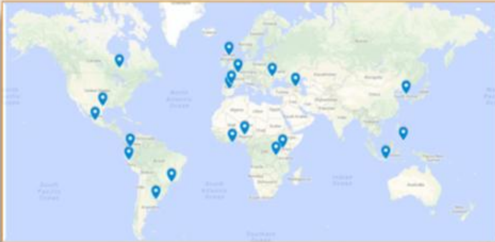
Gobiernos subnacionales dentro del programa piloto OGP - 2018-2020